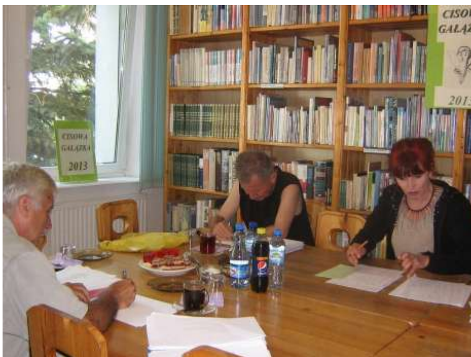
Jury konkursowe – spotkanie przed finałem konkursu o „Cisową gałązkę”