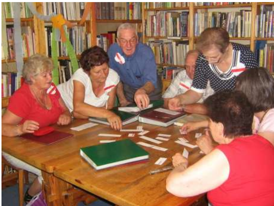
Spotkanie seniorów w bibliotece