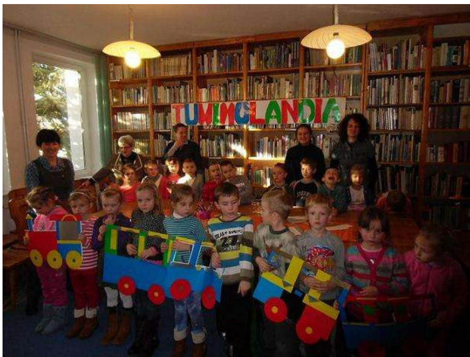
Kasztanki z Przedszkola Gminnego na spotkaniu z okazji Roku Tuwima