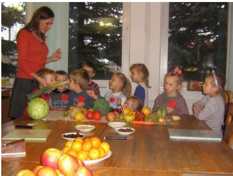
Grupa Zabawowa z Krzywogońca