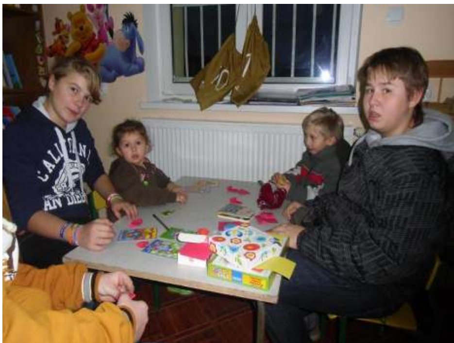
Zajęcia z workami edukacyjnymi w Filii w Małym Gacnie