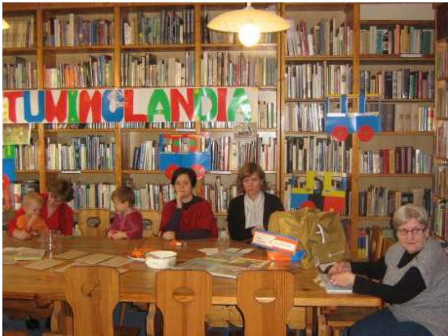
Grupa Zabawowa z Brzozia