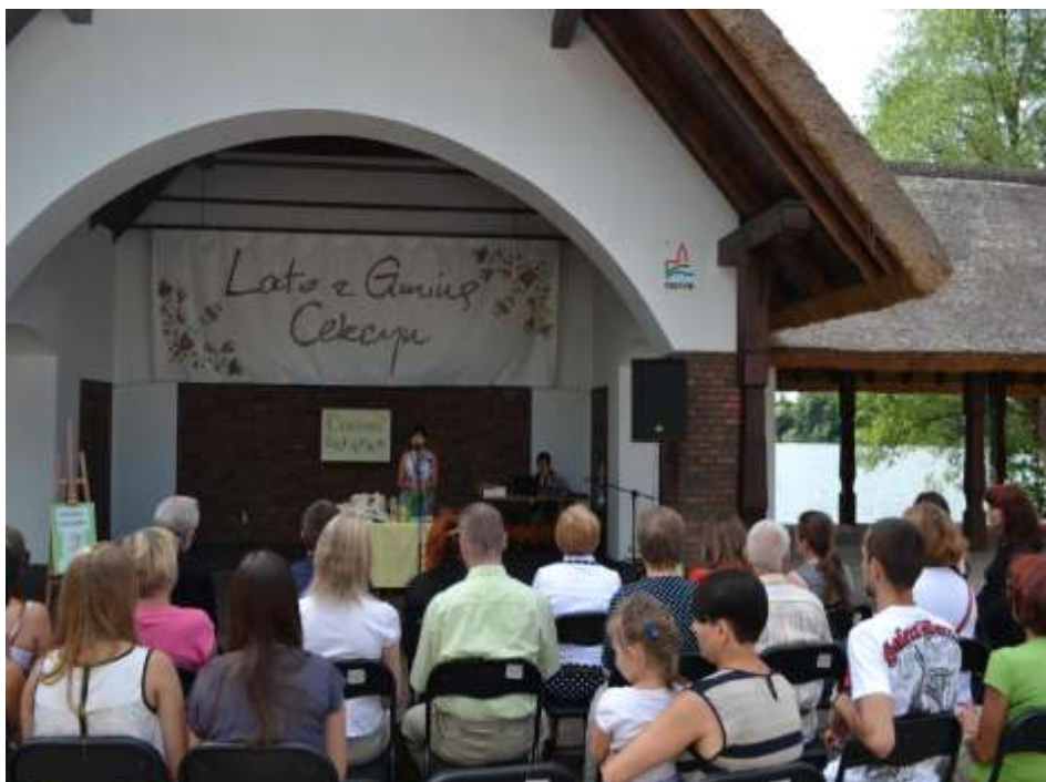
Finał VII edycji ogólnopolskiego Konkursu poetyckiego o „Cisową gałązkę” im. Leona Wyczółkowskiego (amfiteatr nad Jeziorem Wielkim Cekcyńskim)