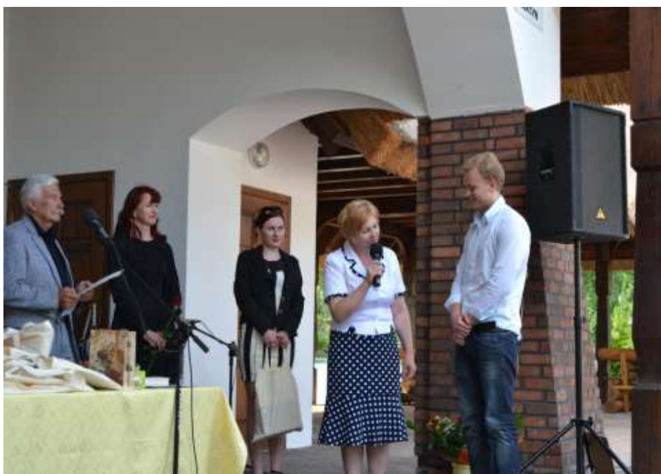
Wręczenie nagrody laureatowi konkursu