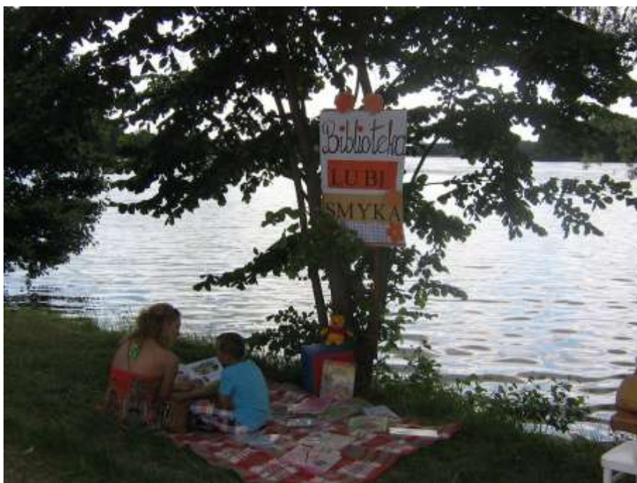
Współorganizowanie pikniku rodzinnego (w ramach Centrum Dziecka i Rodziny)