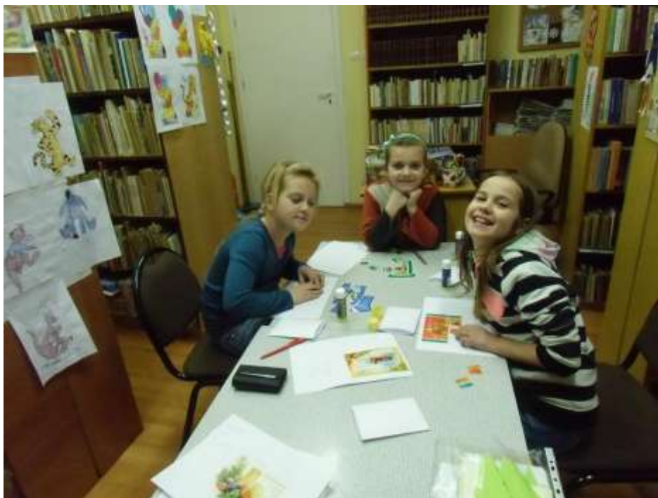
Zajęcia w Filii w Iwcu