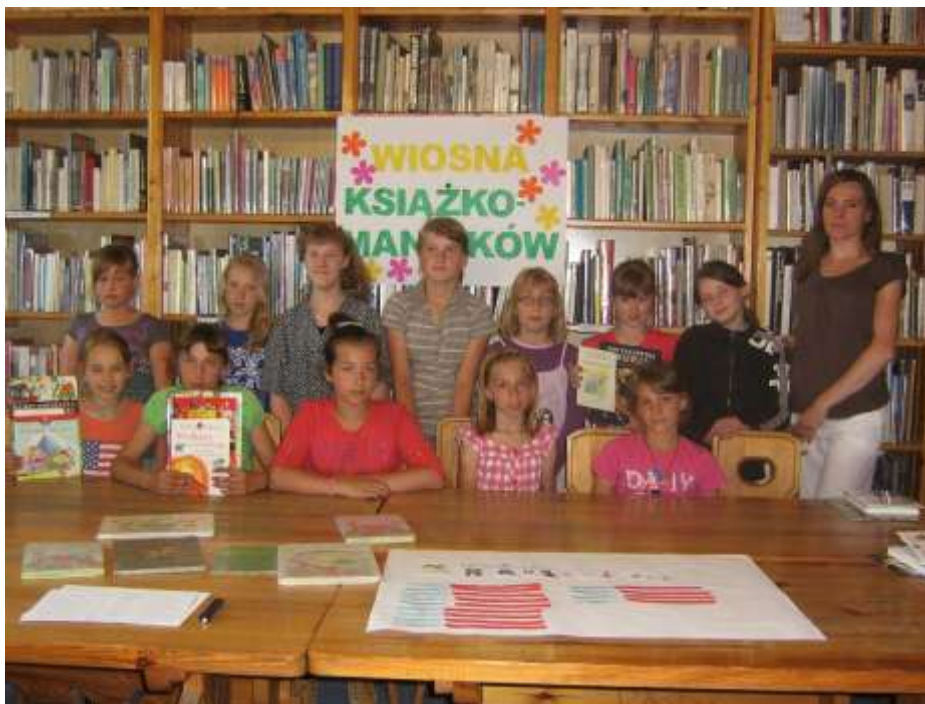
Konkurs czytelniczy „Wiosna Książkomaniaków”, którego finał połączony był z obchodami Roku Tuwima